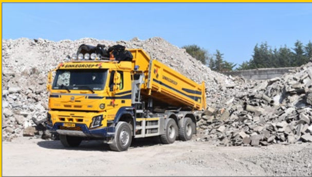
knijperauto - 24 tonmeter kraan