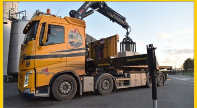
kraanauto - 55 tonmeter