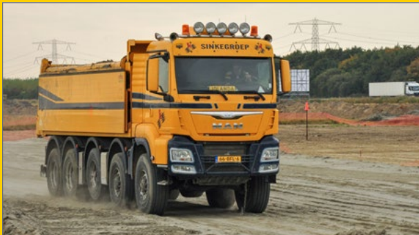
8x8 en 10x8 aangedreven kipper