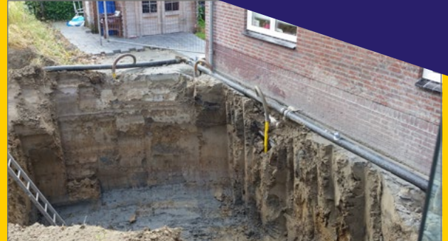
Goes Rossinipad 3 meter diep.