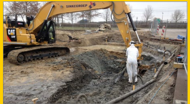
Sanering LambWeston/Meijer Kruiningen.