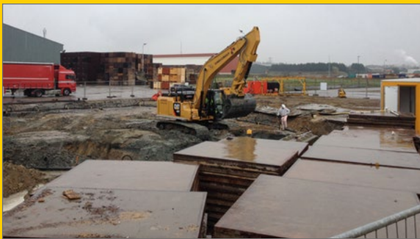
Sanering LambWeston/Meijer Kruiningen.