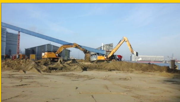
Sanering haventerrein Vlissingen-Oost.